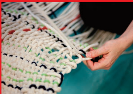
Blanca Casas Brullet, Tapis, 2011 coton tissé, 200 x 80 cm Tapis tissé sur le motif du cahier d'écolier.