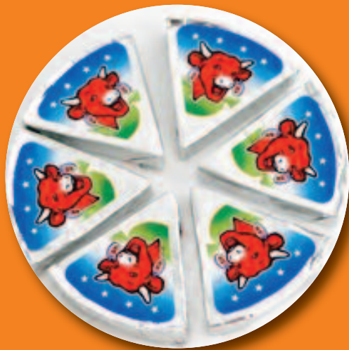
La vache qui rit® en 2011

Du 9 juin au 4 septembre 2011 La Maison de La vache qui rit® dira tout, absolument tout, sur le futur de sa propriétaire !